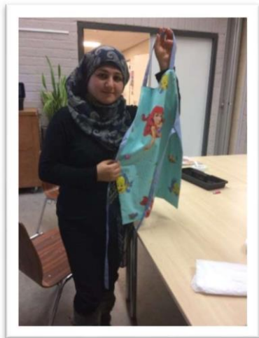
Op naailes leren de vrouwen o.a. schorten te maken.

In onze naailessen brengen wij vrouwen met diverse nationaliteiten bij elkaar. Zij leren onder begeleiding van onze naaidocente hoe ze kleding of kleine gebruiksvoorwerpen kunnen naaien en hoe ze zelf reparaties uit kunnen voeren.