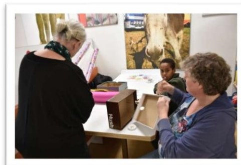
Vrijwilligsters helpen bij het maken van surprises voor het Sinterklaasfeest op school.

Migranten gezinnen weten niet wat het Sint-feest inhoudt en wanneer er dan surprises moeten worden gemaakt voor klasgenootjes helpen wij ze hiermee. Zowel met de uitleg van het feest als het maken van de surprises.