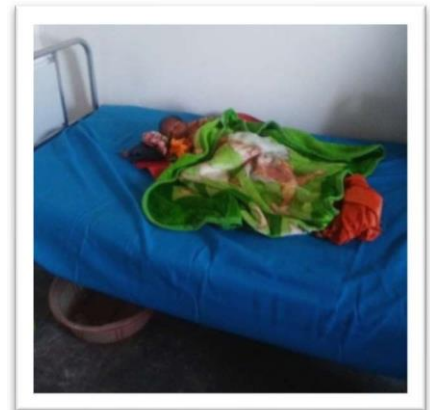
Een jong patiëntje op bed in de kliniek.

Tijdens de droogteperiode waar (onder andere) Somalië in de eerste helft van 2017 mee te maken kreeg, is er veel hulp geboden aan mensen met diarree.